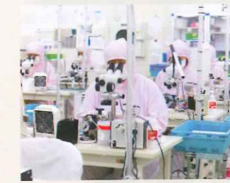
クリーンルームの風景

でも大きな成果を挙げています。2009年にはその功績が評価され、経済産業省が主催する「第3回ものづくり日本大賞」の内閣総理大臣賞を受賞しました。