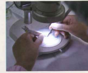
作業のほとんどは顕微鏡で行う