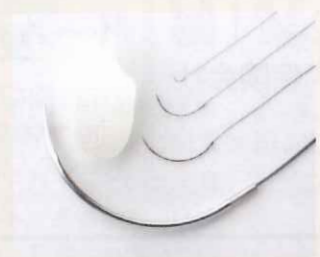
極細針と通常の針とお米

血管を縫える0.03mmの極細な針の実用化は指などの再接着術やこれまで手術が不可能とされた領域の治療に革命的な変化をもたらしました。0.5mm未満の血管やリンパ管、神経などの縫合手術ができるようになった他、赤ちゃんの指先の血管手術