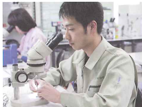
マイクロサージャリーの作成中の様子。