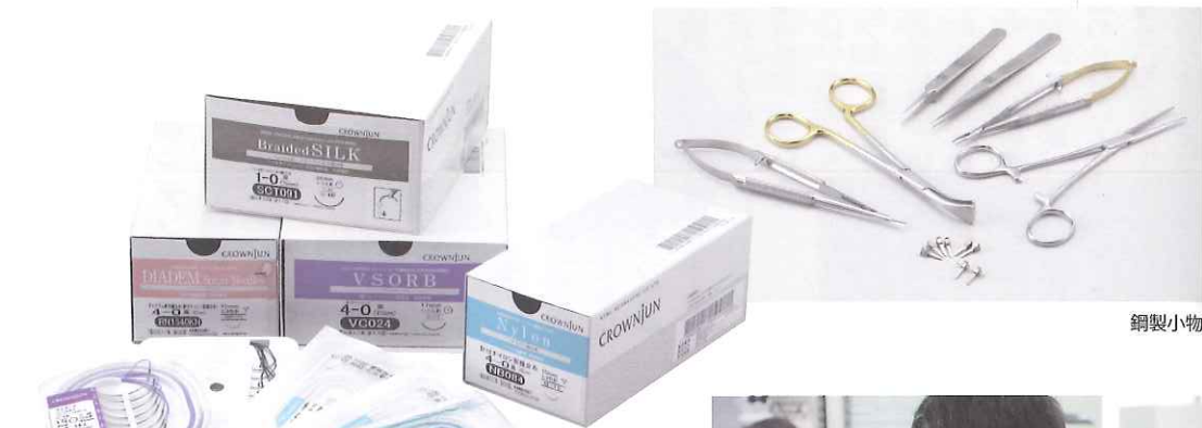
縫合糸各種。上、ブレイドシルク、下、左から、ダイアテム、フイゾーブ、ナイロン。