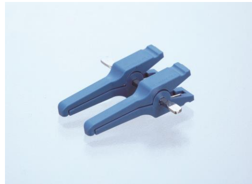
製品イメージ (実際の縮尺とは異なります)